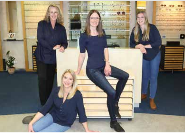
Das Team von Optik Schilling freut sich auf Sie!